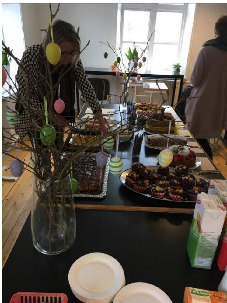
Altid vildt god mad til familie og vennedagen. Her er kagebordet til den fabelagtige kagedyst.